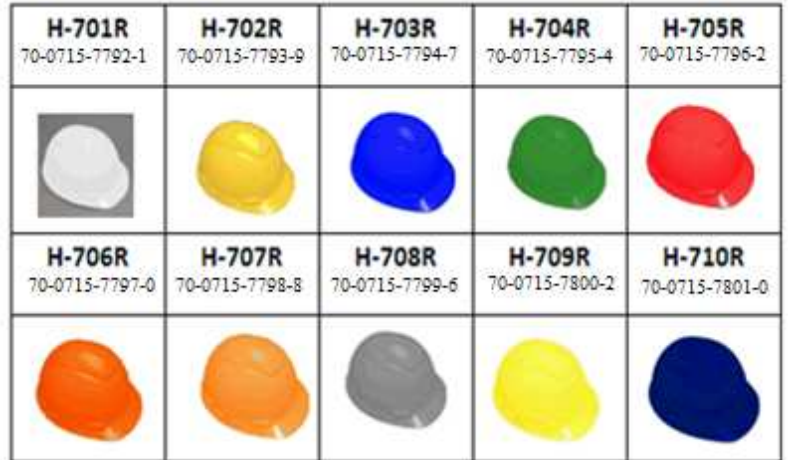
Variedad de colores