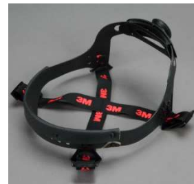
Sistema de suspensión